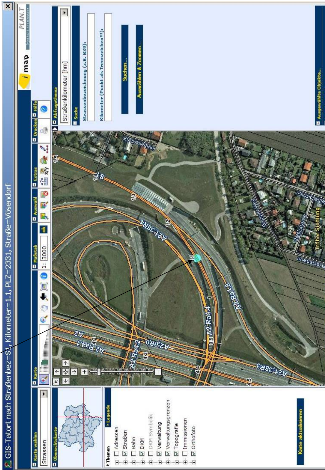
Beispiel 1: Tatortabfrage – der blaue Punkt bezeichnet den Tatort

In der Folge werden zwei Anwendungsbeispiele aus dem Strafenprogramm NEU dargestellt: