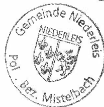
Leopold Kitir Vizebürgermeister